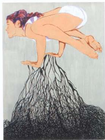
Ángeles Agrela, "Contorsionista", 2007, acrílico sobre papel, 200 x 150 cm.

La galería Casaborne, establecida en Antequera (Málaga), exhibe las piezas seleccionadas en la muestra Born III . ■