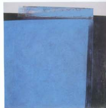
Silvia Lerín, "Vaivén de azul", 2006, técnica mixta sobre tela.